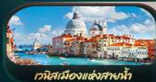
เวนิสเมืองแห่งสายน้ำ