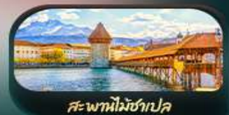
สะพานไม้ม้าเปด