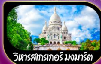
วิหารสกรเทอร์ มงมาร์ต