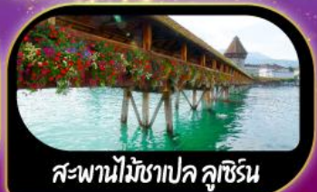
สะพานไม้ฆาปค ลูซิริน