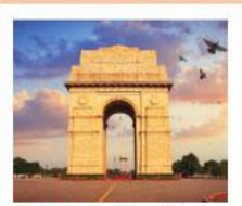
♥♥♥ India Gate