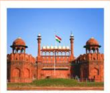
♥♥♥ Agra Fort