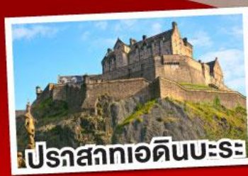
ปราสาทเอดิินบะระ