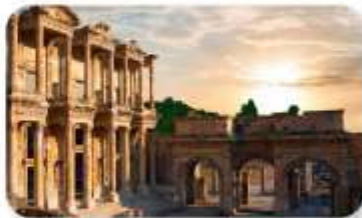
เมืองโบราณเอฟเฟซุส