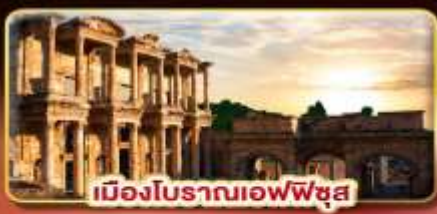
เมืองโบราณเอเฟซุส