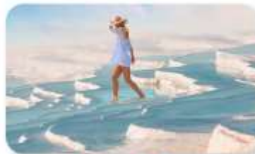
ปราสาทปูยฝาย