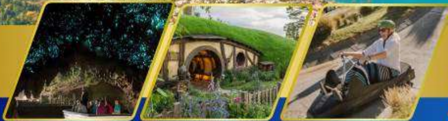
ถ้ำหอนเรื่องแสง