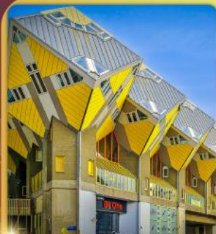
บ้านลูกเต๋า โคกคูนุส

“ล่องเรือหลังคากระจก” ชมกรุงอัมสเตอร์ดัม