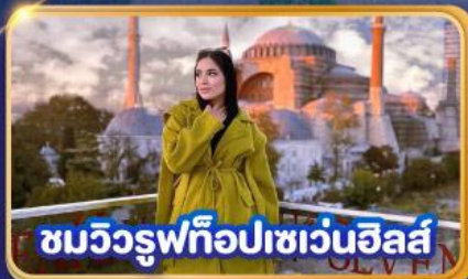
ชมวิวยุโรปเซเวนฮิลส์