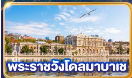
พระราชวังโดลมาบาซ