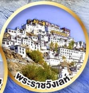
พระราชวังเลห์