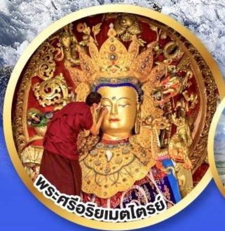
พระศรีอริยเมตไตรย์