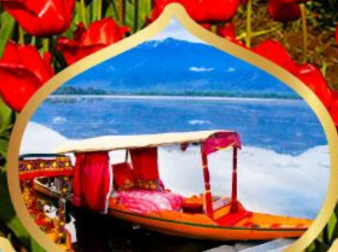
ล่องเรือชิคาร่า