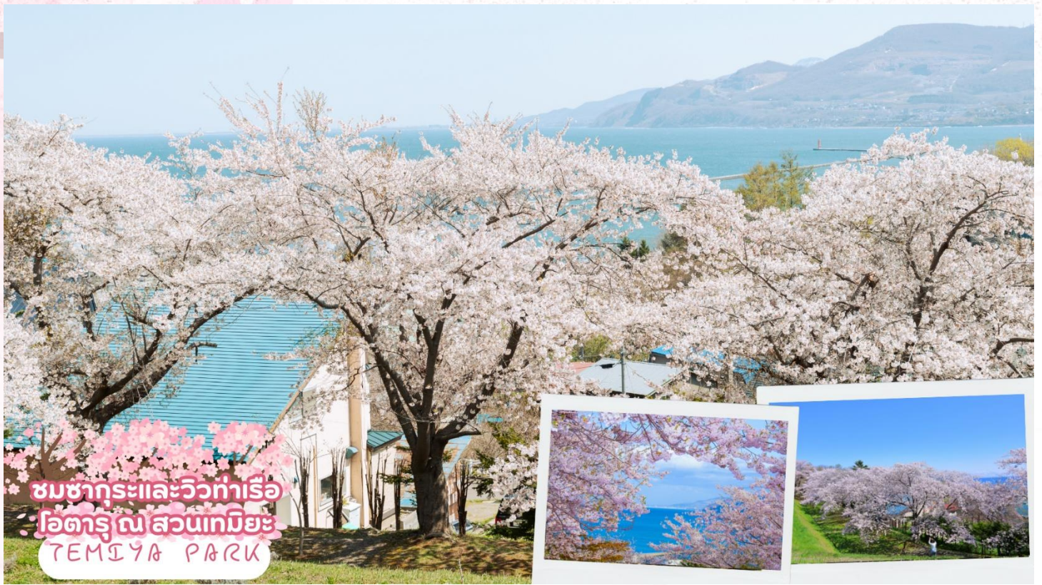
ชมซากุระและวิวท่าเรือ โอดารุ ณ สวนเทมิยะ TEMIYA PARK

ชมซากุระและวิวท่าเรือโอดารุ ณ สวนเทมิยะ (Temiya Park) เป็นหนึ่งในจุดชมดอกซากุระที่โด่งดังที่สุดในโอดารุในฤดูชมซากุระ อยู่บนภูเขา ช่วงฤดูดอกซากุระผู้คนจะหนาแน่น เนื่องจากที่นี่สามารถชมซากุระพร้อมกับชมทิวทัศน์ท่าเรือโอดารุ เหมาะสำหรับการพักผ่อนหย่อนใจและเพลิดเพลินกับวิวทะเลและดอกซากุระ โดยซากุระจะเริ่มบานในช่วงปลายเดือนเมษายนถึงต้นเดือนพฤษภาคม (ซากุระขึ้นอยู่กับสภาพอากาศของแต่ละปี)