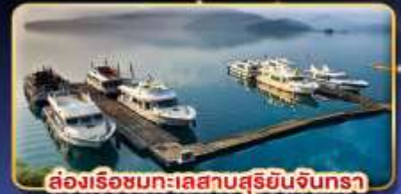
ส่องเรือชมทะเลสาบสุริยอันจินตรา