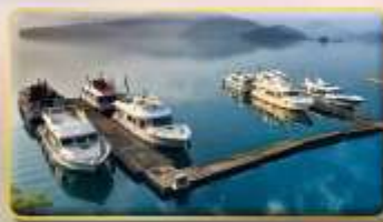
ล่องเรือชมทะเลสาบสุริยันจินทรา