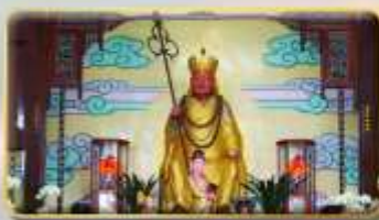
วัดพระกั๊งซำจั้ง