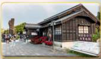
หมู่บ้านฮินกั