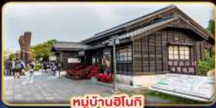
หมู่บ้านฮินกิ

"ไทเป" มหานครแห่งเมืองสี่พัน เที่ยวจุใจ เช็กอินจุดไฮไลท์