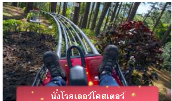
นั่งโรลเลอร์โคสเตอร์