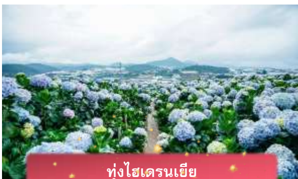
ทุ่งไฮเดรนเยีย

นำท่านเล่น นั่งโรลเลอร์โคสเตอร์ ชมธรรมชาติท่ามกลางป่าสนไปยัง น้ำตกตาดต้นลา สัมผัสอากาศบริสุทธิ์และบรรยากาศสดชื่น พร้อมจิบเครื่องดื่มชม วิวธรรมชาติ นำท่านเดินทางสู่ ทุ่งไฮเดรนเยีย อีกหนึ่งทุ่งดอกไม้ ที่ไม่ควรพลาดมาถ่ายรูปกัน ข้อดีของที่นี่ คือ ดอกไม้จะบานตลอดทั้งปี