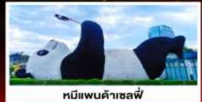
หมีแพนด้าเซลฟี่