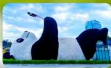
หมีแพนด้าเซลฟ์