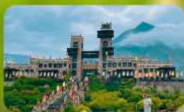
หมู่บ้านโบราณชนเผ่าเซียง