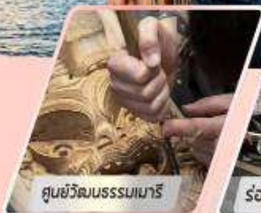
ศูนย์วัฒนธรรมเมารี

เที่ยวเกาะใต้ และเกาะเหนือ : 12 วัน 10 คืน