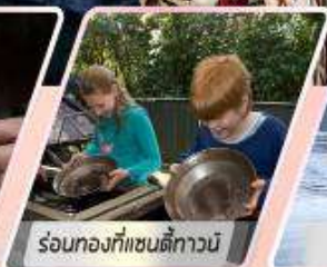
ร้อนทองที่แซนดี้ทาวน์