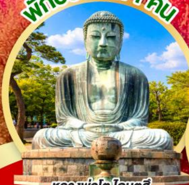
หลวงพ่อดโต โดบุตสึ