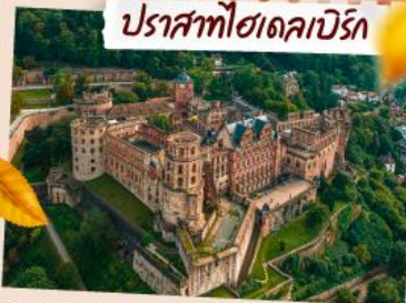
ปราสาทโวลเดอเปริก