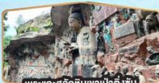
พระแกะสลักหินงาป่าตั้งชัน