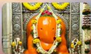
องค์อิชฏวินายัก