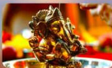
ร่วมพิธี Abhishekam