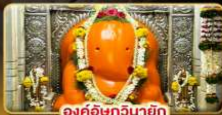
องค์อชฎินายัก