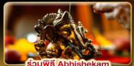
ร่วมพิธี Abhishekam