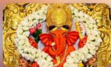
องค์สิทธิวินายัก