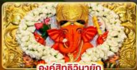
องค์สิทธินายัก