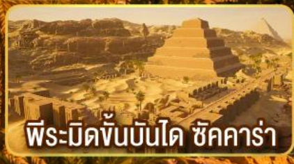
พีระมิดขั้นบันได ชิคคาร์่า