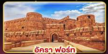
อัครา ฟอรั